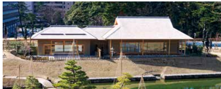
从官守坂望见玉泉庵