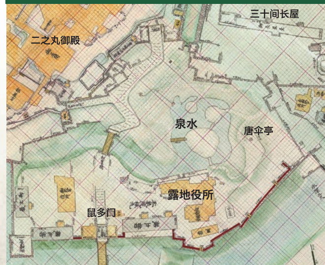
嘉永3年（1850）《御城分间御绘图》（公益财団法人）前田育徳会 收藏