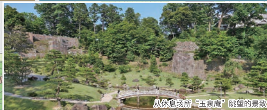
从休息场所“玉泉庵”眺望的景致

庭园水源引自城内的辰巳用水，是池泉回游式大名庭园，从池底到周围石垣最高处的高低差达22米，造型具有立体感。该庭园主要由与瀑布浑然一体的色纸短册积石垣等独具匠心的石垣群构成，被认为是其它庭园无法比拟的独创性庭园。