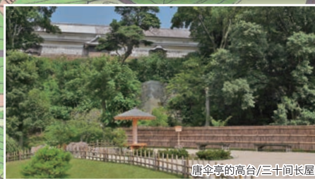
唐伞亭的高台/三十间长屋