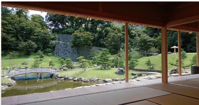
从和室眺望的景致

在江户时代曾设置露地役所（负责庭院整修管理的官署）的场所，整修了能够将庭园一览无余的休息场所“玉泉庵”。该设施不仅具有休息功能，还有可用作服务处及茶室的和室。和室除了提供奉茶服务以外，还可用作正式茶会等多种用途。