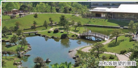
从松坂眺望的景致