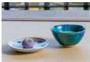
말차(가루녹차)와 오리지널 생과자

다른 곳에서는 보기 드문 입체적인 정원의 매력을 느껴보면서 말차(가루녹차)와 매 계절의 오리지널 생과자를 맛보며 더 없이 행복한 휴식 시간을 즐기십시오.