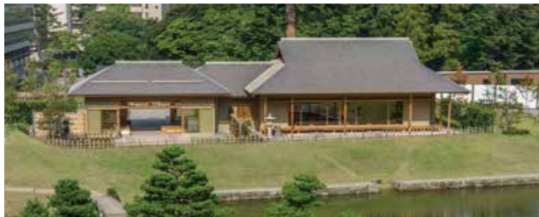
이모리자카(비탈길)에서 바라본 교쿠센안