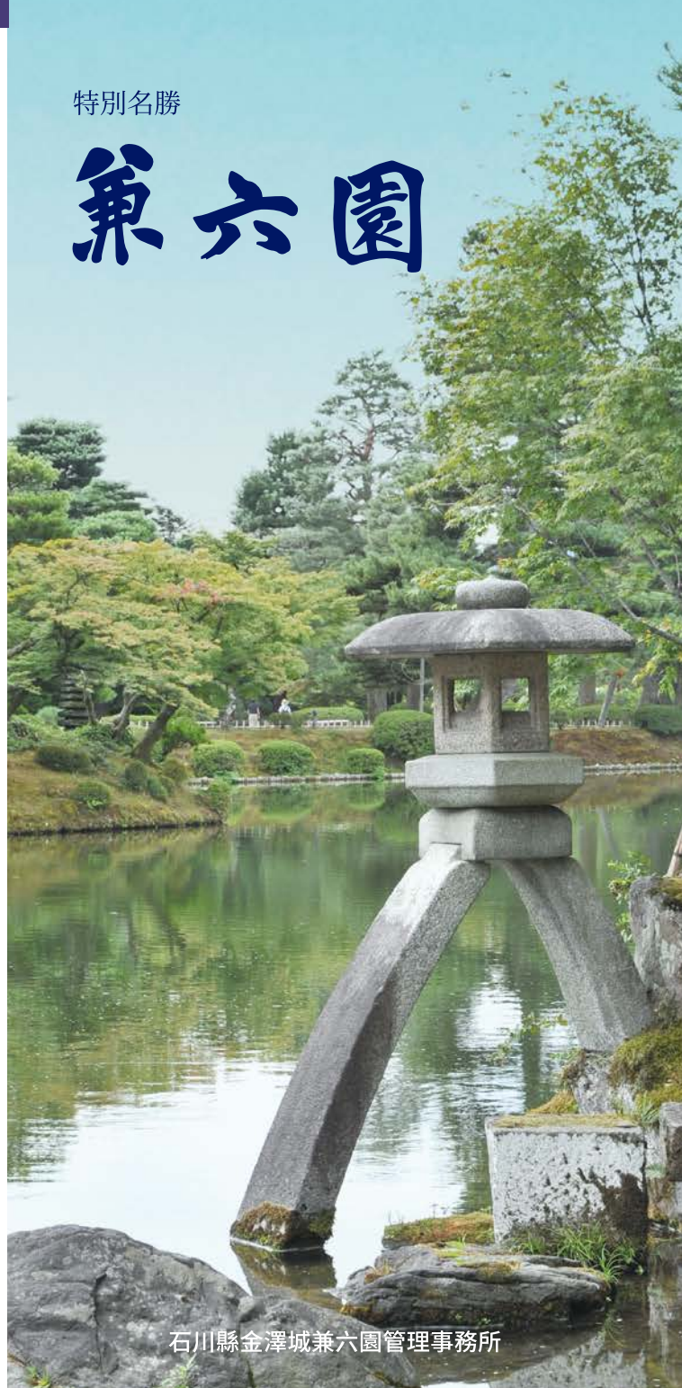
石川縣金澤城兼六園管理事務所