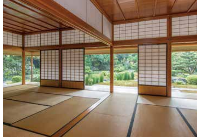
후쿠젠노 마 방에서 조망한 정원