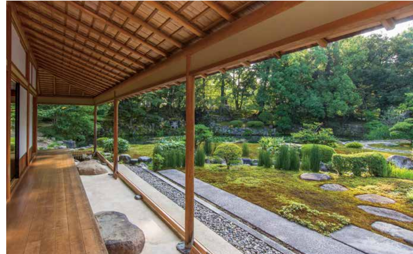
빗마루에서 본 정원