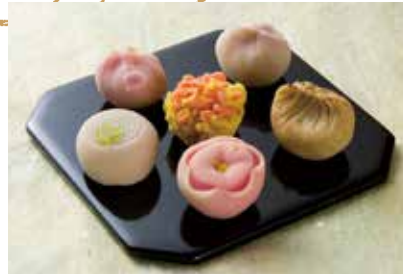
매 계절의 오리지널 생과자

가가 번(藩: 에도시대의 영지 구분) 5대 번주(藩主) 마에다 쓰나노리는 1676년에 건축 담당 부서를 성내에 옮기고 그 철거지에 렌치(蓮池) 저택을 세워 그 주변에 정원을 정비했다. 이것이 겐로쿠엔의 시작이다. 6대 번주인 마에다 요시노리는 저택을 재건하였고 영주에 의한 영내 정치 후기에는 시구레테이라고 불리기도 했다. 메이지 시대(19세기) 초엽에 해체될 때까지 현재의 분수 앞쪽에 자리 잡고 있었다. 2000년 3월 현재 장소에 건물을 재현하였다. 정원측 타타미 10장 크기 객실 및 타타미 8장 크기 객실, 그리고 여기서 이어진 울타리는 잔존해 있었던 당시 평면도를 바탕으로 하여 복원된 부분이다.