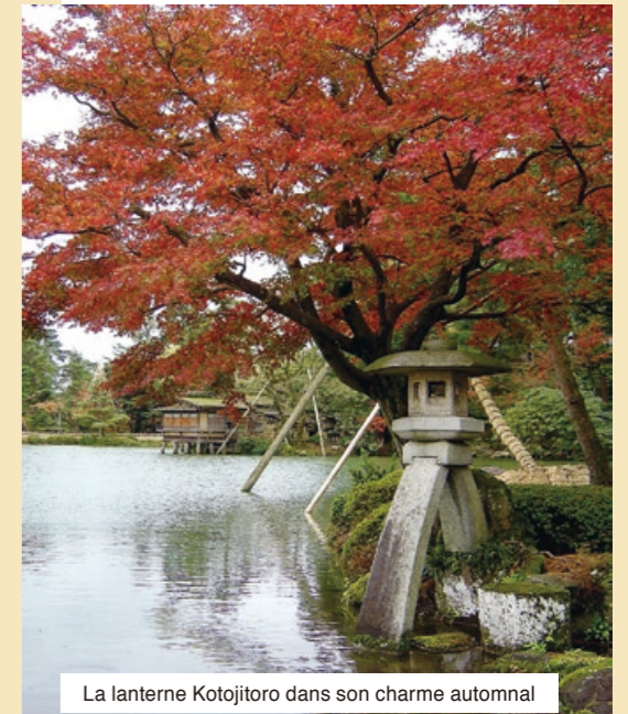
La lanterne Kotojitoro dans son charme automnal

Bureau de gestion du Parc du Château de Kanazawa et du Jardin Kenrokuen