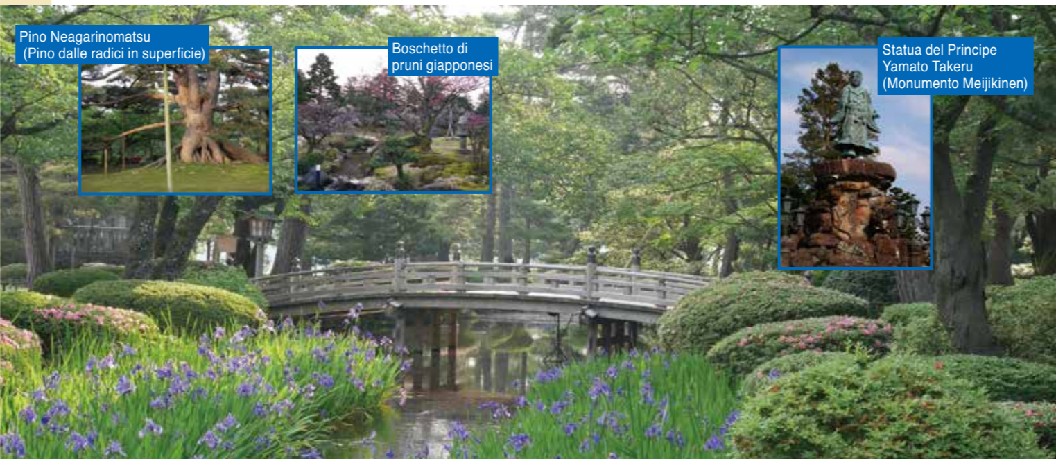
Pino Neagarinomatsu (Pino dalle radici in superficie)