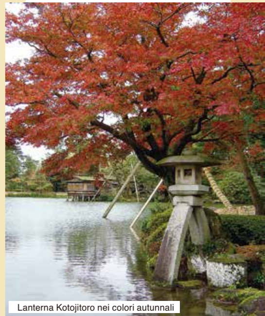
Lantern Kotojitoro nei colori autunnali

Giardino designato come bene culturale e sito nazionale per la sua speciale bellezza paesaggistica