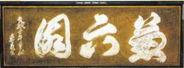
สวนเค็นโรคุเอ็น

น้ำพุที่เก่าแก่ที่สุดของญี่ปุ่น นำน้ำพุมาจากสระน้ำคาซุมิกะอิเคะ น้ำพุแห่งนี้ทำงานโดยใช้แรงดันธรรมชาติซึ่งเกิดจากความแตกต่างของระดับสระน้ำสองแห่ง โดยปกติแล้วน้ำพุมีความสูง 3.5 เมตร แต่จะเปลี่ยนแปลงไปตามระดับน้ำของสระน้ำคาซุมิกะอิเคะ ทั้งนี้ กล่าวกันว่าน้ำพุแห่งนี้สร้างขึ้นเพื่อใช้เป็นดินแบบสำหรับการก่อสร้างน้ำพุในปราสาทในปี พ.ศ. 2404