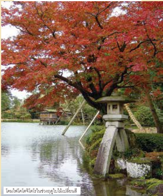
โคมไฟโคโตะจิโรในช่วงฤดูใบไม้เปลี่ยนสี