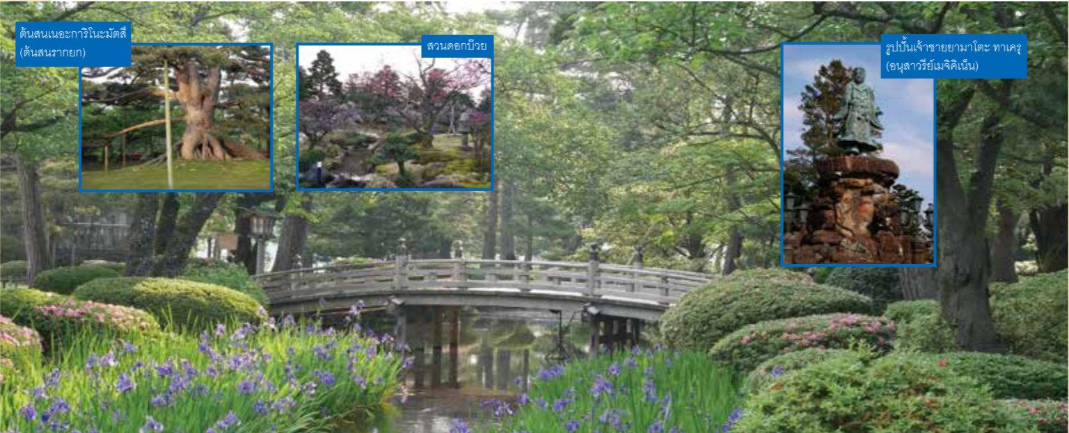
ต้นสนเนอะกาจิโนะมัตสึ (ต้นสนร่ายก)

คุณสามารถชมดอกไม้ที่สวยงามนานาพันธุ์ โดยเฉพาะอย่างยิ่งดอกซากุระ ดอกอาซาเลียญี่ปุ่น และดอกไม้โรสได้จากบนสะพาน